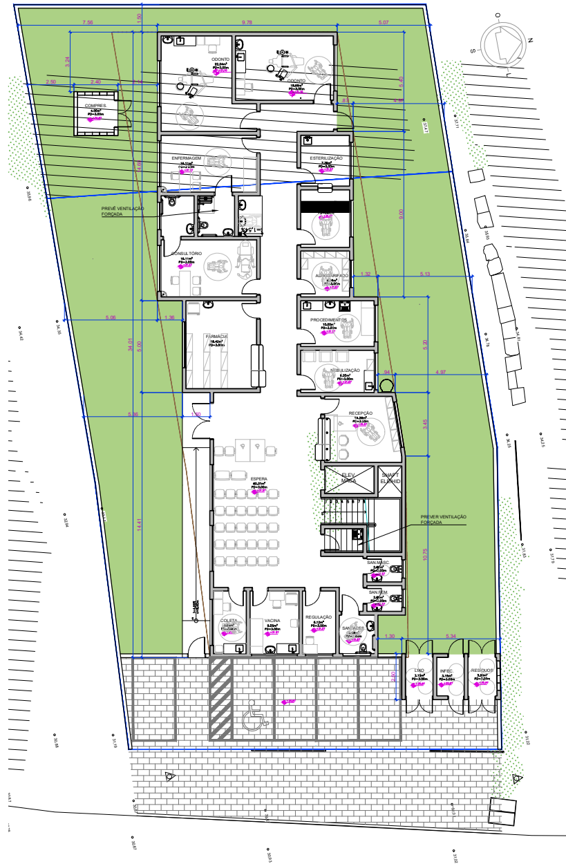
1 ESTUDO DE IMPLANTAÇÃO - TÉRREO ESCALA 1/100