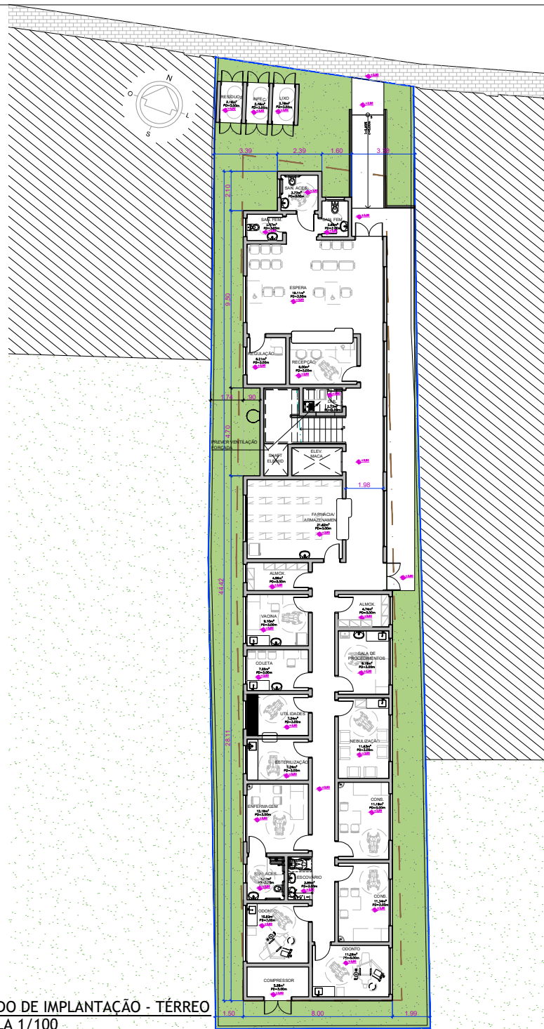
1 ESTUDO DE IMPLANTAÇÃO - TÉRREO ESCALA 1/100